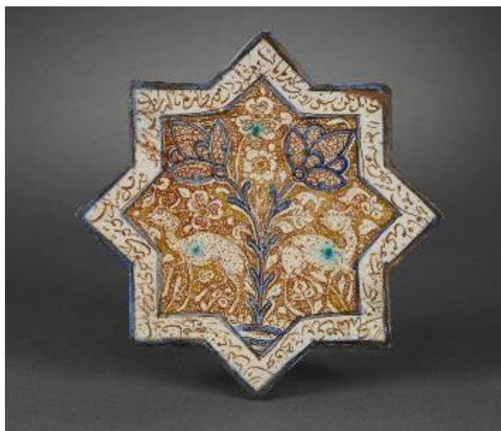
Etoile aux gazelles, Iran, Kashan, période ilkhanide, seconde moitié XIIIe-début XIVe siècle. Dim. 21 x 21 cm