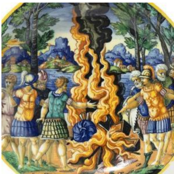
Coupe sur piédouche en majolique d'Urbino à décor " a istoriato " représentant « Tarquinio offre la proie des hostilités au dieu Vulcain » - Vers 1550. Diamètre : 26,5cm

Écuelle à bouillon et son présentoir en porcelaine tendre de Sèvres à fond bleu. XVIIIe siècle. Lettre date « Z » pour 1777. Marque du peintre Chappuis le jeune et marque du doreur Boulanger. Hauteur de l'écuelle : 9,5 cm – Présentoir : 18,3 x 14 cm.