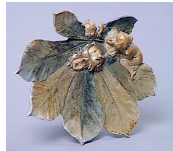
Vide-poches : marronnier - Joseph Chéret, manufacture nationale de Sèvres, grès cérame, vers 1900. N° d'inventaire : MNC 10851

15h – « Merveilles ! Regard sur les collections du musée national de céramique de Sèvres - 1800-1945 » par Christine Vivet-Pecllet, Conservatrice en chef du patrimoine, Chargée des collections du XIXe – XXe, Sèvres musée national de céramique.