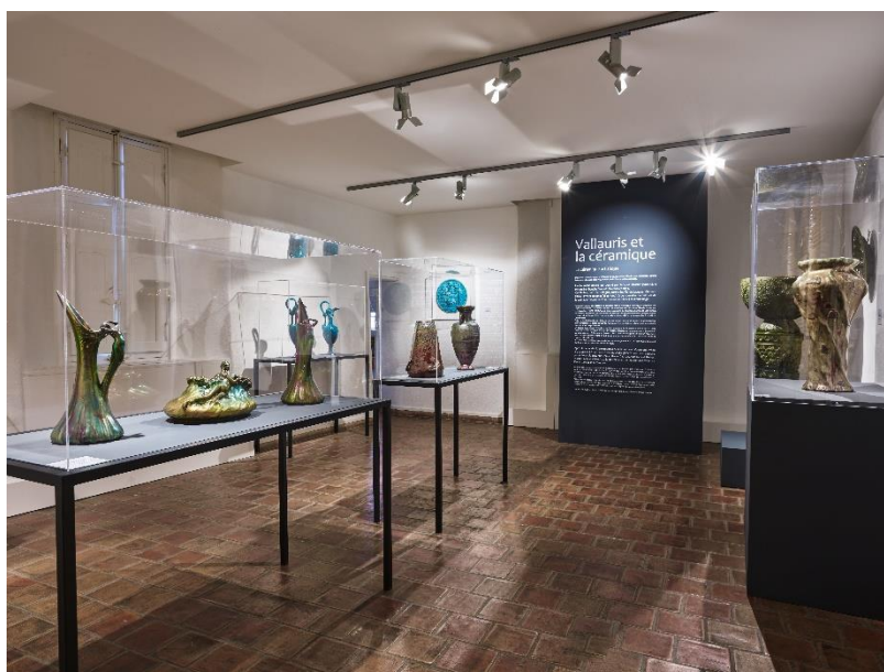
Salle Massier, musée Magnelli, 2021

En 1968 est inaugurée la Biennale Internationale de Céramique d'Art, avec un concours dont les œuvres primées deviennent propriété du futur musée de la Céramique qui ouvrira en 1977 et prendra le nom de musée Magnelli* en 1996.